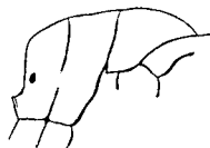
Camponotus carbo ♂ torace.

Specie assai caratteristica, tutta nera e opaca. Il capo è un po' più lungo che largo, più stretto in avanti, coperto di punti assai stivati, sparso di punti più grossi, ciascuno dei quali dà origine ad una piccolissima setola depressa; le mandibole sono appena lucenti, sottilmente punteggiate, con 6 denti; il clipeo non